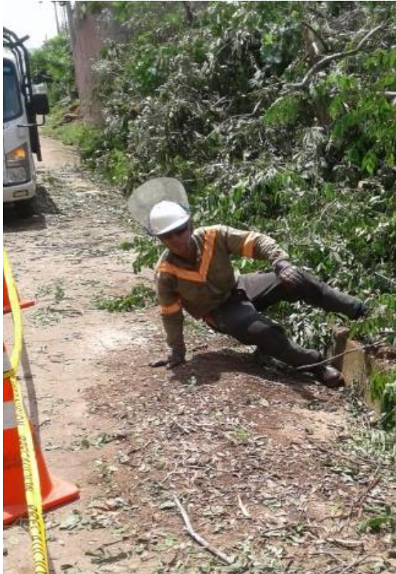
Imagen de recreación

Podador Auxiliar realizaba tareas a nivel de piso en sector de Caserío Ahuchapío en Ahuachapán; alrededor de las 10:50 AM mientras lanzaba unos trozos hacia un costado de la calle (sobre la banqueta), el empleado gira el torso para dar el paso, se para sobre una rama que había quedado del picado desbalanceando al podador y haciendo que gire con todo su peso sobre su rodilla derecha provocando su caída (ver imagen). Empleado manifiesta dolor agudo y es trasladado hacia Clínica empresarial de CLESA para evaluación, siendo referido al Hospital del ISSS de Sonsonate para toma de radiografías resultando con esguince en su rodilla. Cirujano ortopeda colocó yeso, recomendando tres (3) semanas para curar la tensión, empleado es dado de alta con incapacidad médica inicial de 30 días para su recuperación.