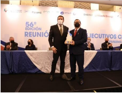
1° puesto: ISA REP – Perú