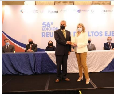
2° puesto: UTE – Uruguay