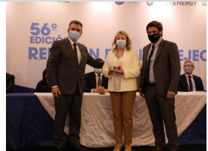
3° puesto: UTE - Uruguay