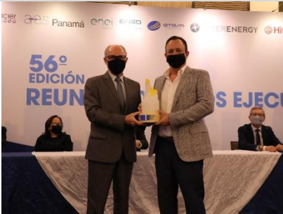
1° puesto: AES El Salvador