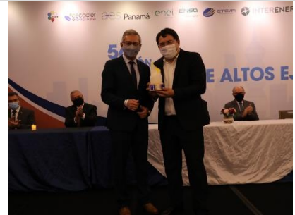
3° puesto: COPEL Distribuição – Brasil