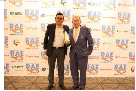
3° puesto ESPH – Costa Rica