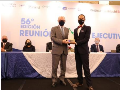
1° puesto: TRECSA – Guatemala