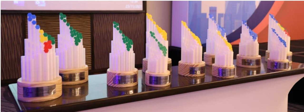
Trofeos entregados a los vencedores del Premio CIER de Innovación 2021