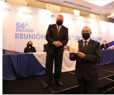
2° puesto: CENACE – Ecuador