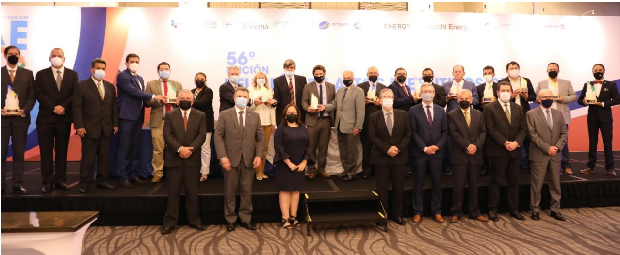
Autoridades de CIER y representantes de las empresas y proyectos premiados con el Premio CIER de Innovación 2021, en la Ceremonia de Premiación.