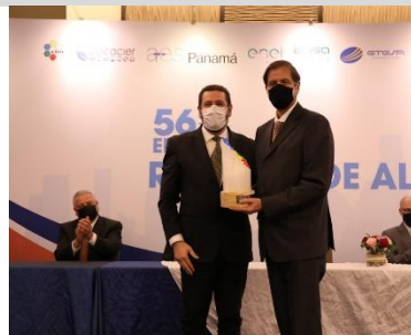
ISA – Colombia