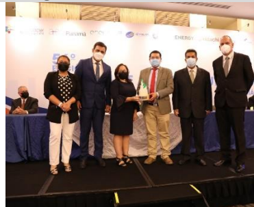
2° puesto: ELECTRONOROESTE – Perú